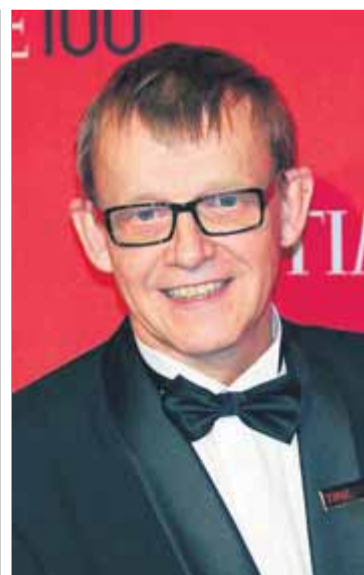
El llibre i Hans Rosling, que va morir l'any passat

les preguntes, algunes com aquesta: “Quin percentatge de nens d'un any estan vacunats contra alguna malaltia al món? El 20, el 50 o el 80 per cent?” O aquesta altra, que sembla ben fàcil, però que molta gent falla: “Quina és l'esperança de vida actualment al món? 50, 60 o 70 anys?” Molts dels milers d'enquestats que han contestat Rosling han equivocat la resposta, sobretot perquè han tingut la tendència que, justament, denuncia el metge suec: la majoria de la gent, sobretot a Occident, pensa realment que el món cau a trossos i que tenim al davant un futur ple de fam, guerres i catàstrofes naturals, quan tots els indicadors demostren el contrari. És el cas de les dues preguntes anteriors: més del 80% dels nens d'un any al món estan vacunats i l'esperança de vida és de 70 anys, actualment. Oi que no s'ho pensaven?