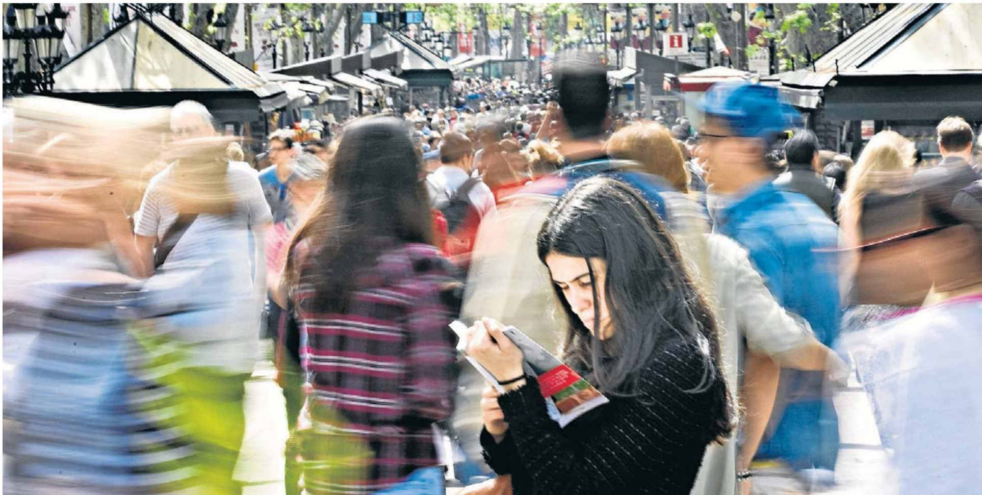
Durant la diada de Sant Jordi –a la foto, en una imatge d'arxiu– els llibreters venen en un dia el 5% de llibres que es despaxaran en tot l'any. XAVIER BERTRAL