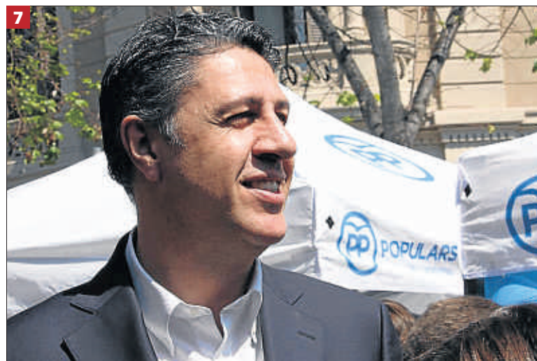
GARRIDO R. / ACN