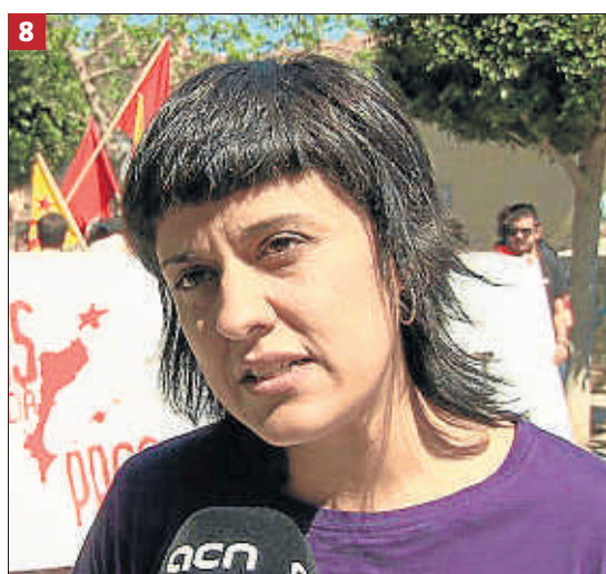
SOLER JOSÉ / ACN