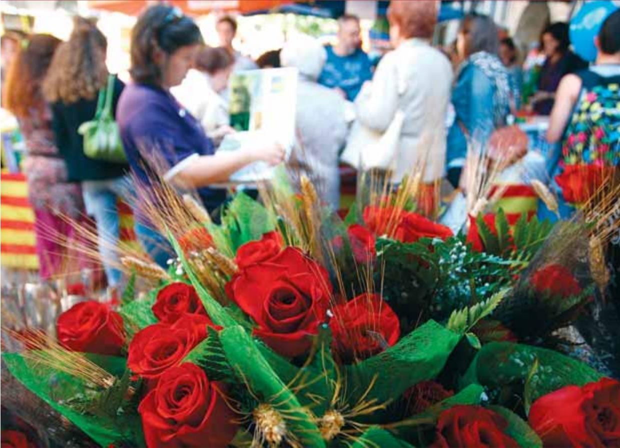
Roses, gent i llibres a la rambla de la Llibertat de Girona, ahir al matí