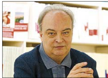
ENRIQUE VILA-MATAS 'Aire de Dylan'

Mendoza ha afegit a la seva habitual inclinació ciutadana una de les faules grotesques que tant li agraden. Una Barcelona insòlita.