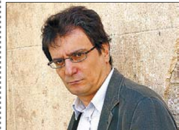
ALBERT SÁNCHEZ PIÑOL 'Victus'