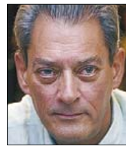
► Paul Auster.

sa poètica i els models clàssics, sense oblidar la seva particular mirada iconoclasta. Entre els poemaris més esperats hi ha Es perd el senyal (Proa), on Joan Margarit ha abocat les seves claus autobiogràfiques més personals i que és també una memòria generacional de contingut cívic, i Canción errónea (Tusquets), amb què Antonio Gamoneda prossegueix la indagació poètica que li va valer el premi Cervantes.