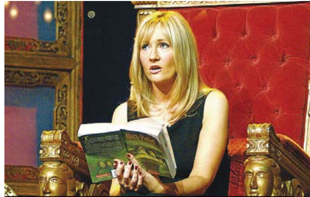
J. K. ROWLING La reina dels llibres juvenils es passa a la literatura adulta.

► Curios. Haruki Murakami, l'autor japonès amb més fans, ocupa la primera posició –s'haurà de veure– en les quínieles al Nobel d'aquest any. La seva novel·la Balla, balla, balla (Empúries/Tusquets) no és una novetat estricta –va ser escrita el 1988– però