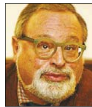
► Fernando Savater.

pasa por dentro (Destino). Josep Ramoneda (RBA) fa una constructiva dissecció de la confusió de valors en els partits polítics progressistes amb La izquierda necesaria (RBA). I dos savis de l'economia com Joseph Stiglitz i George Soros aporten el seu coneixement al tema amb El precio de la desigualdad (Taurus) i La tormenta financiera (Destino). Si es desitgen detalls sobre Grècia, són a La espada de Damocles (Tusquets) els assajos de Petros Markaris.