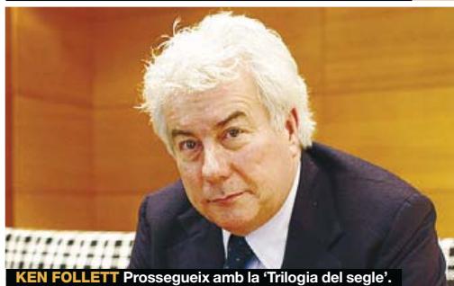
KEN FOLLETT Prosegueix amb la 'Trilogia del segle'.