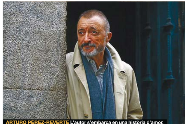
ARTURO PÉREZ-REVERTE L'autor s'embarca en una història d'amor.

té l'alienc de ser la següent al seu gran èxit Tokio Blues . L'aparició d' El àngel esmeralda (Seix Barral), nou relats de Don DeLillo, coincidirà amb l'estrena a Espanya de la versió cinematogràfica que David Cronenberg ha fet d'una altra gran novel·la del nord-americà, Cosmópolis .