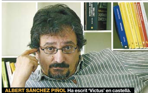
ALBERT SÁNCHEZ PIÑOL Ha escrit 'Victus' en castellà.