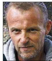
► Jo Nesbo.

Notables és també la decisió de Quaterns Crema / Acantilado de recuperar la integral de l'obra de Simenon. Començarà a l'octubre amb El gat . I la de Planeta, que torna a les llibreries tots els casos del detectiu Carvalho del recordat Manuel Vázquez Montalbán.