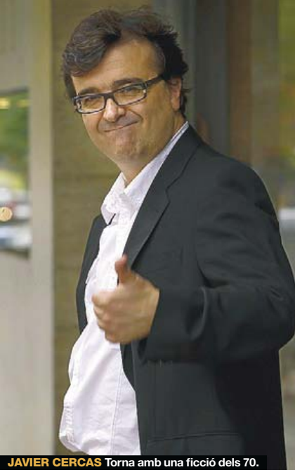
JAVIER CERCAS Torna amb una ficció dels 70.