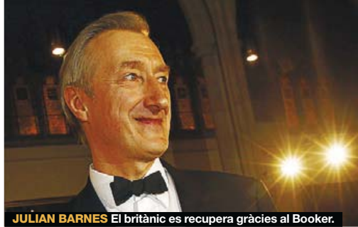
JULIAN BARNES El britànic es recupera gràcies al Booker.