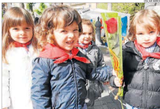
Els més petits, amb roses, asseguren el futur de la festa.

El va seguir l'última aventura de l'escriptor Eduardo Mendoza 'El enredo de la bolsa y la vida' (Seix Barral). Entre els autors de Ponent, va destacar per golejada Carles Porta, amb 'Fago. Si et diuen que el teu germà és un assassí' (La Campana). De fet, el periodista i productor audiovisual va estar firmant llibres a Barcelona i Lleida amb ampli èxit de convocatòria a les dos ciutats. "És una satisfacció incre-