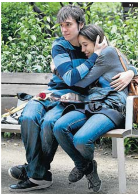
LLEGIR I ESTIMAR 01. Enguany s'han comprat més roses, de tota mena i a preus molt diversos. 02. La varietat de novetats ha diversificat les vendes. 03. El dia laborable va afavorir que hi hagués més gent passejant.