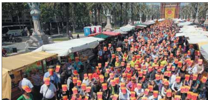
EL Passeig Il·lús Companys fou escenari d'una gran festa anti-nuclear