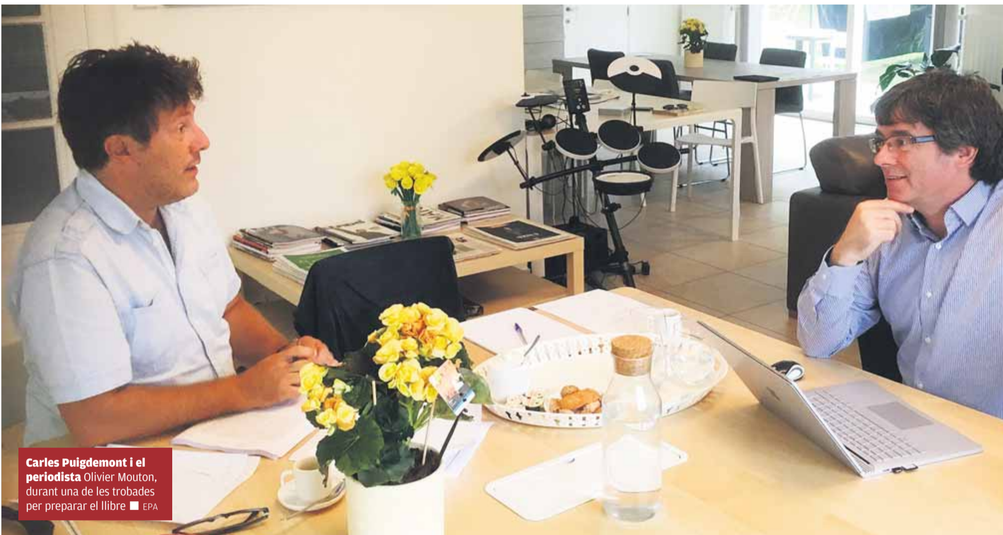
Carles Puigdemont i el periodista Olivier Mouton, durant una de les trobades per preparar el llibre