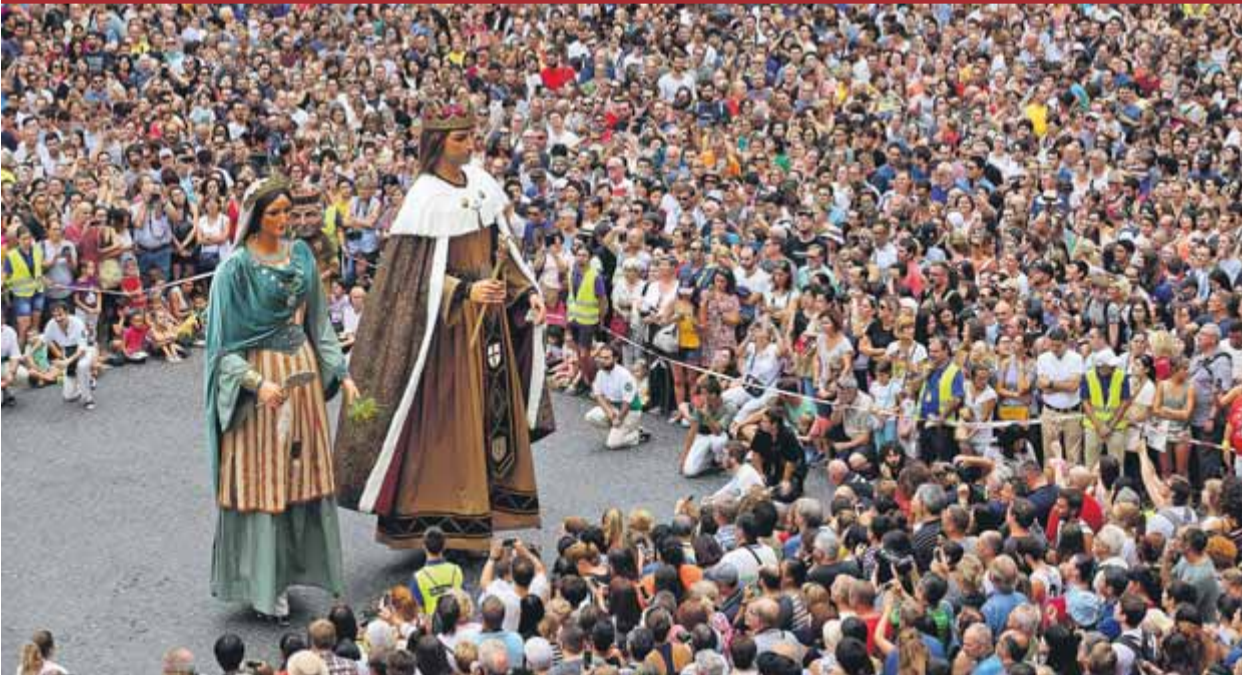
Els gegants, durant el ball d'ahir al matí a la plaça de Sant Jaume