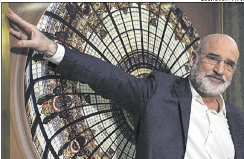
▶▶ Fernando Aramburu, a l'Institut Cervantes, a principis de març.

Aquesta immersió en l'esfera de la seva intimitat no ha adoptat la forma d'una autobiografia o un autoretrat convencionals perquè Aramburu ha volgut respectar l'estructura discontinua del mecanisme mental que ens proporciona la impressió d'unicitat i identitat, la de ser nosaltres mateixos. Per a això ha operat al revés que l'autobiògraf: no explica l'esdevenir exterior de la seva vida, sinó la repercussió interior d'aquest esdevenir. Ha desposseït