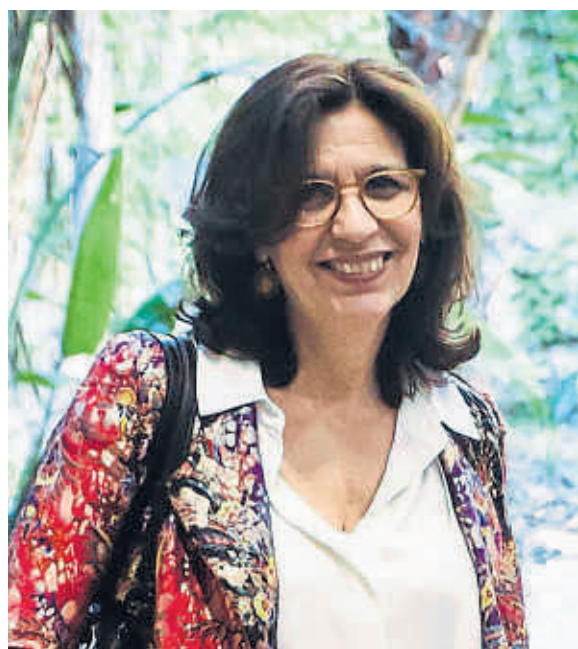
R.J. Palacio en la seva visita de fa poc a Barcelona

L’assetjament escolar tractat en to de comèdia clàssica i un protagonista carismàtic, les claus de l’èxit