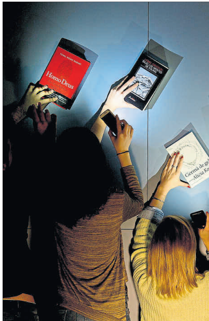
Un grup de lectors il·luminant les cinc millors obres del 2016