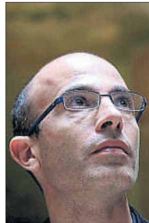
Yuval Noah Harari

Després d'haver sintetitzat en unes 500 pàgines tota la història de la humanitat en el seu llibre anterior, Sapiens , ara l'historiador israelià Yuval Noah Harari (Kiryat Ata, 1976) s'aventura a explorar com serà el món del futur. Amb una prosa que defuig l'academicisme, comença formulant-se dues preguntes clau: què és un humà? Què és la religió? Allò que ens definiria seria el llenguatge, única eina comunicativa en el regne animal capaç de crear ficcions que cohesionen un gran nombre de persones. Per això, tot i que els neandertals eren més forts que els sapiens, aquests darrers van perviure, per la seva capacitat de mentir: manipulant i fent circular mites i zafareries. Ara, en una nova etapa, la bioenginyeria, la nanotecnologia i la intel·ligència artificial permetran superar l' Homo sapiens , amb màquines i algorismes que substituiran no només els treballadors sinó que controlaran les principals decisions de les nostres vides.