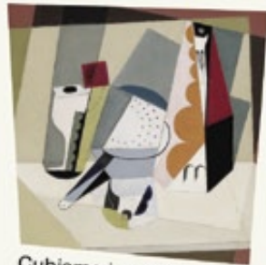
Cubisme i guerra. El cristall dins la flama Museu Picasso