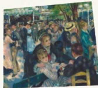
Renoir entre dones Fundació Mapfre