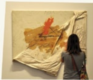
Col·lecció (1966 -1976) Fundació Tàpies