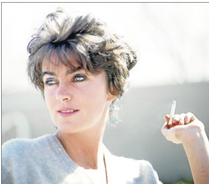
▶▶ Lucia Berlin.