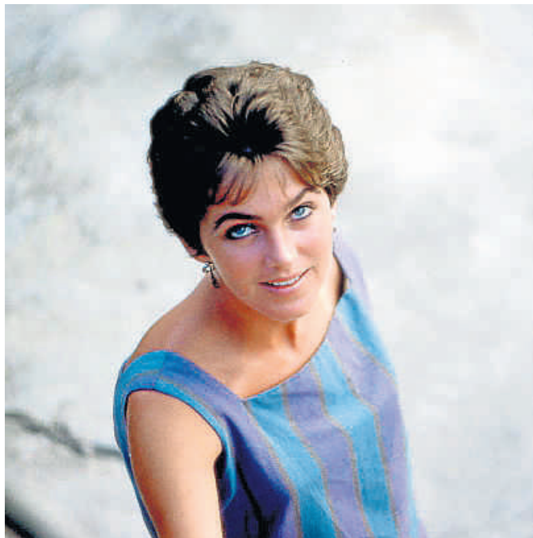
Lucia Berlin, fotografiada el 1962