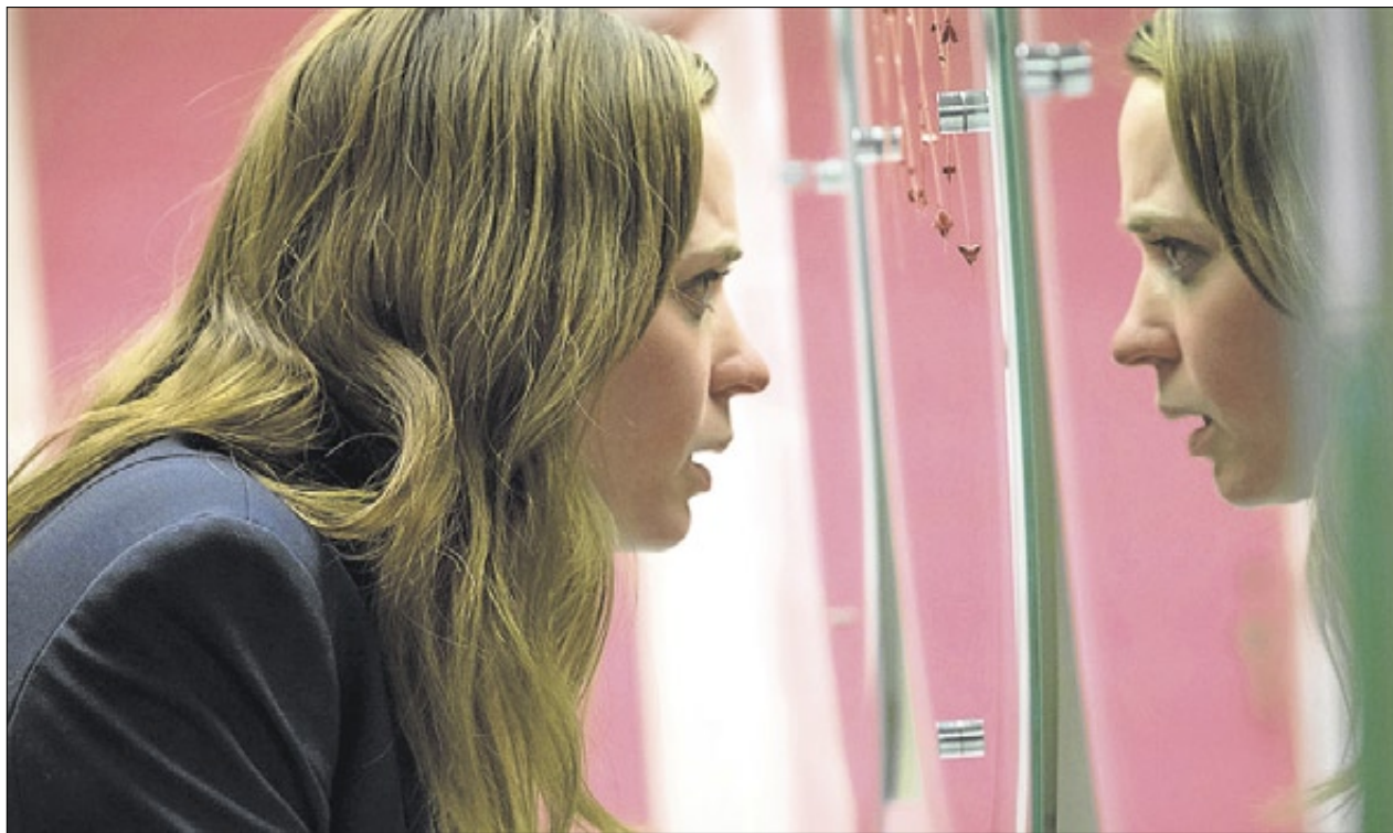
▶▶ L'actriu Emily Blunt, en una escena de 'La chica del tren'.

L'actriu britànica dona vida a una alcohòlica en el 'thriller' que adapta al cine el 'best-seller' 'La noia del tren'