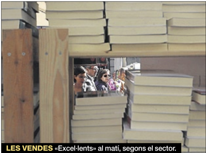
LES VENDES «Excel·lents» al matí, segons el sector.

hores, però no a Girona, on va caure un xàfec a les 16.00 hores) van fer allargar la tarda als vianants, quan molts llibreters temien que després del dinar i la migdiada hi hagués una retirada general.