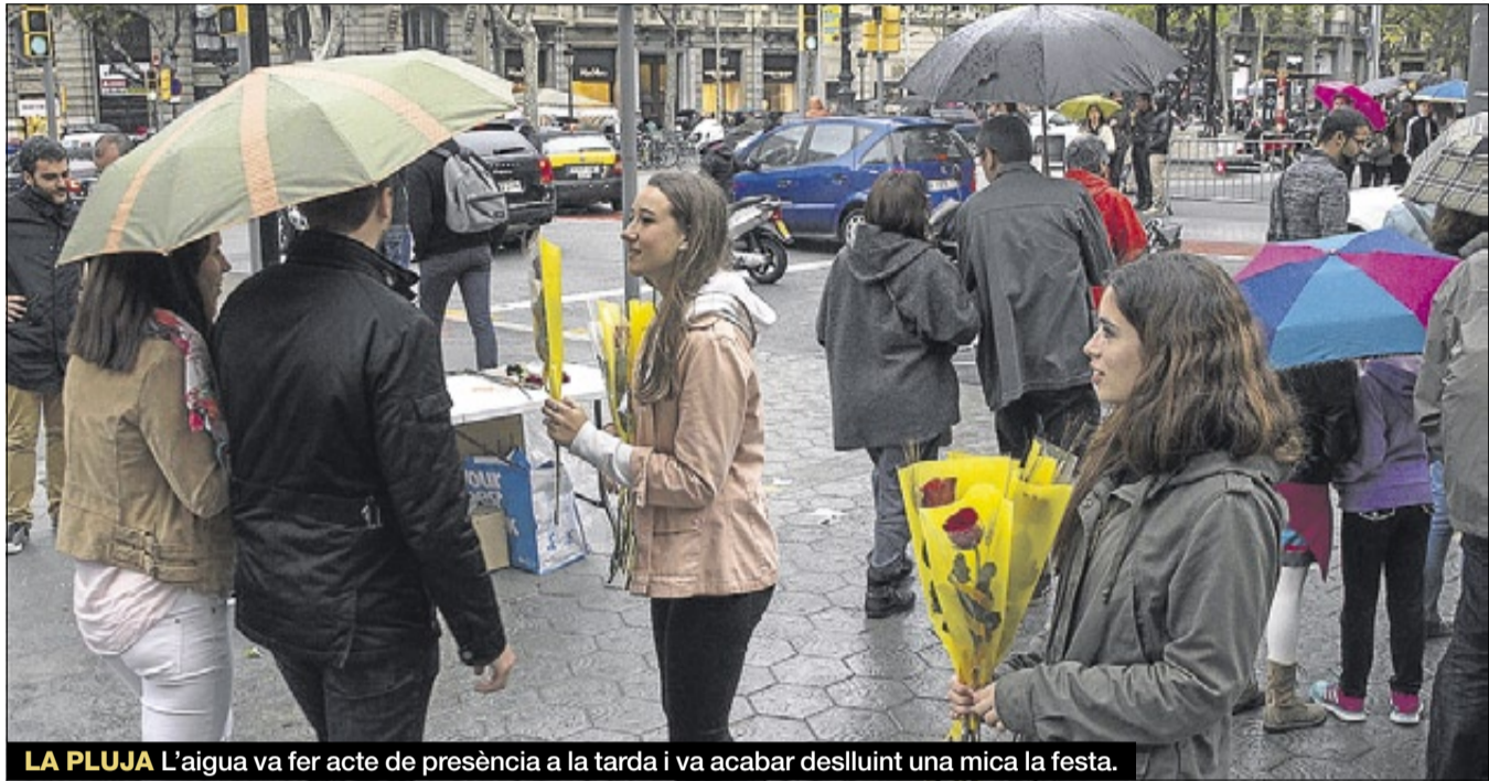
LA PLUJA L'aigua va fer acte de presència a la tarda i va acabar deslluïnt una mica la festa.