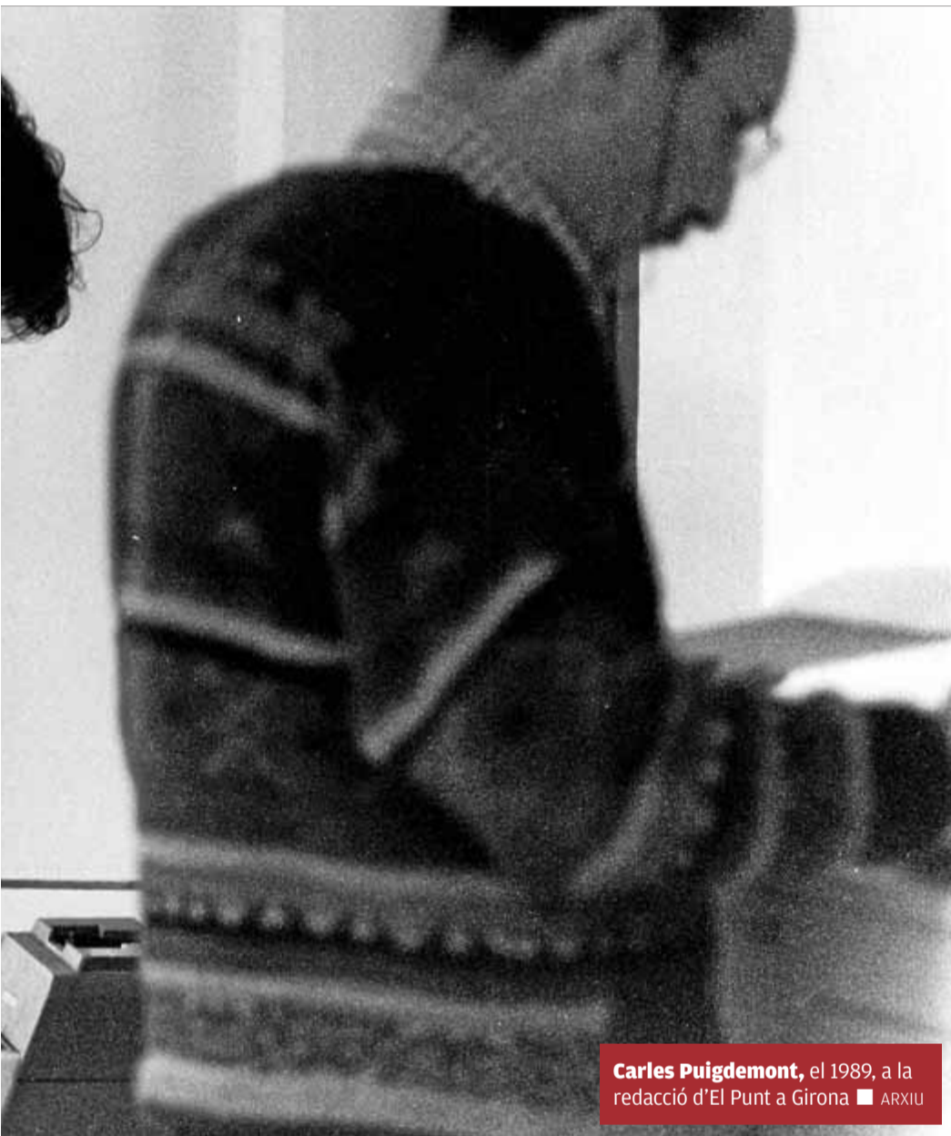
Carles Puigdemont, el 1989, a la redacció d'El Punt a Girona