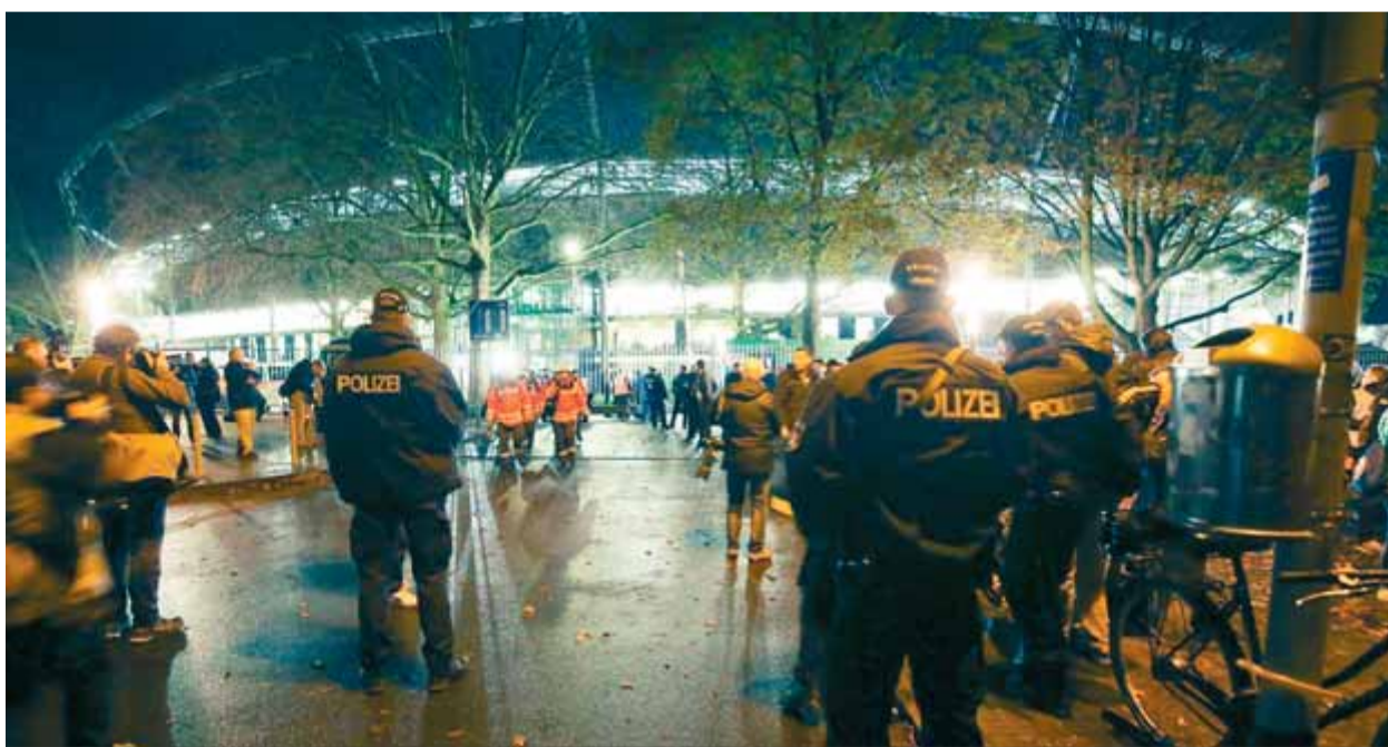
La policia no va trobar cap artefacte explosiu a l'interior de l'estadi alemany

ACCIÓ • Desallotgen l'estadi poc abans de l'Alemanya-Holanda pel risc d'atemptat FRANÇA • La policia busca un segon terrorista fugitiu