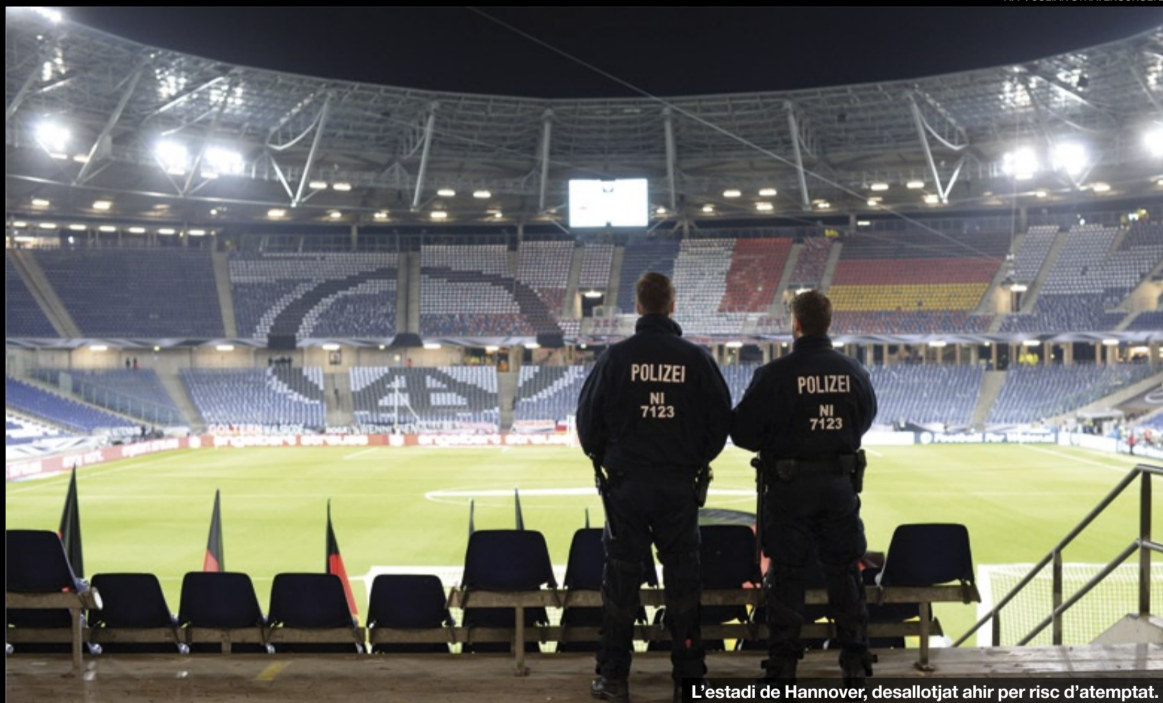
L'estadi de Hannover, desallotjat ahir per risc d'atemptat.

Els experts consideren ineficaç i regressiu el pla francès